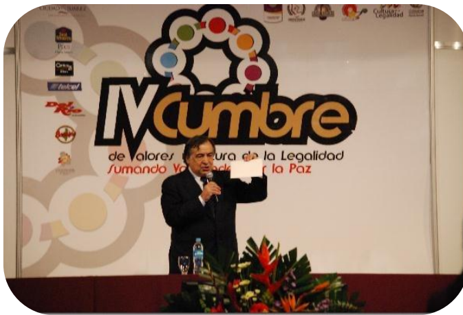
Leoluca Orlando, Alcalde Palermo, Sicilia, Italia.